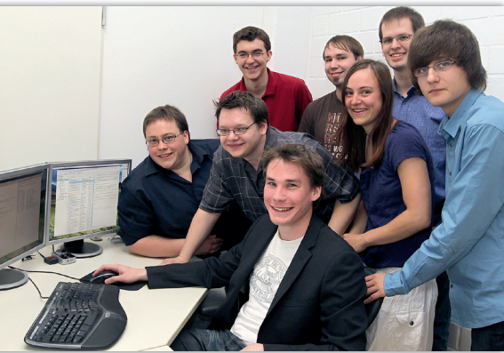
Abb. 1: IServ - Ein junges dynamisches Team

Die Anforderungen an eine Serverlösung für Schulen sind komplex. Eine große, häufig wechselnde Benutzergruppe mit entsprechenden Anforderungen braucht eine intuitiv bedienbare Arbeitsumgebung. Eine ehemalige Schülerfirma löst diese Aufgabe seit 10 Jahren mit ihrer Serversoftware IServ, die den Anspruch erhebt, so zuverlässig und einfach bedienbar zu sein, wie das Vorbild mit dem Apfel.